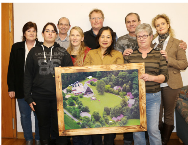
Unser Team sorgt für Ihren angenehmen Aufenthalt.