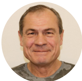
Johann Dippel Schreinerei/Grünanlagen