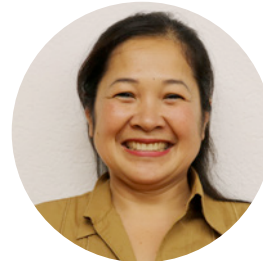
Khem Hendlmaier Reinigung